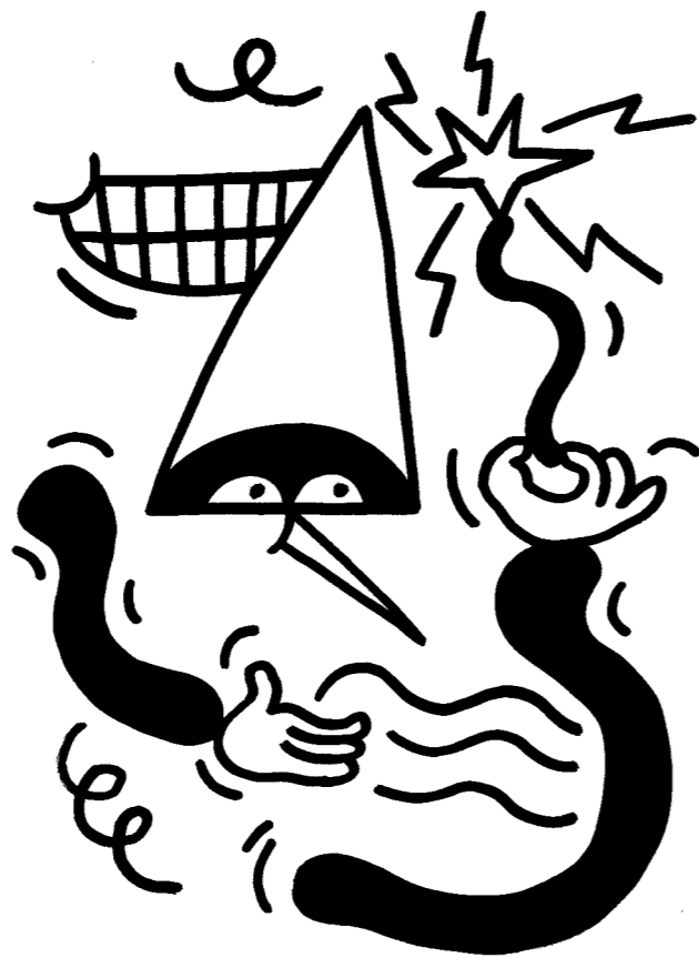
Demain, la soirée des hypnotiseuses..., par Orian